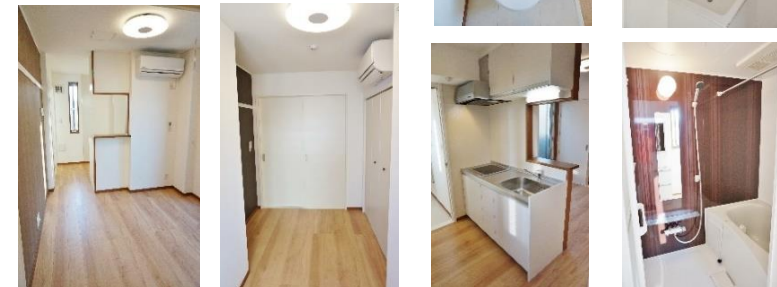
■図面と現況が異なる場合は現況を優先致します