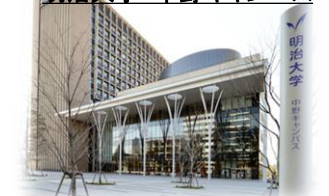
明治大学 中野キャンパス