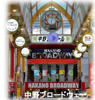
中野ブロードウェイ