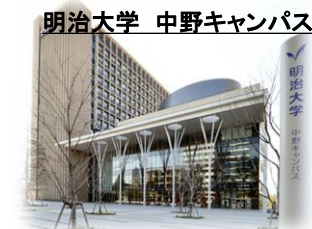
明治大学 中野キャンパス