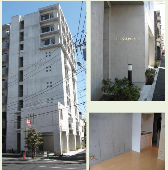
注:他の部屋の写真を使用しております