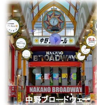
中野ブロードウェイ