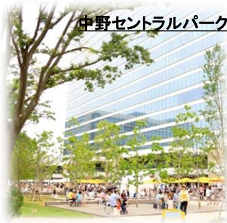
中野セントラルパーク