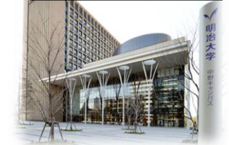
明治大学 中野キャンパス