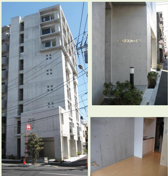
注:他の部屋の写真を使用しております