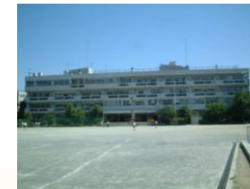
第二中学校 徒歩5分