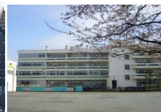
第七小学校 徒歩4分