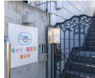
建物内認可保育園あり