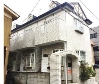
閑静な住宅街の物件