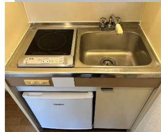
嬉しいミニ冷蔵庫付き