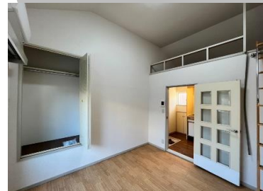
使い方はあなた次第! ロフト付!!