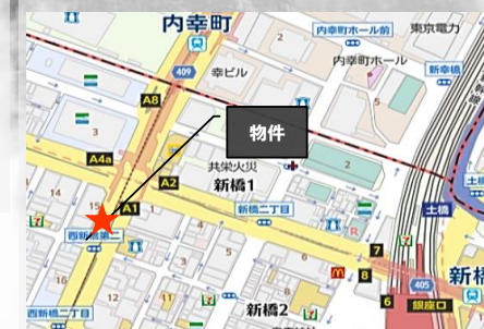
※図面・写真と現況が異なる場合は現況を優先します。