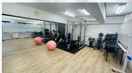
※写真は現テナント入居中の物になります。