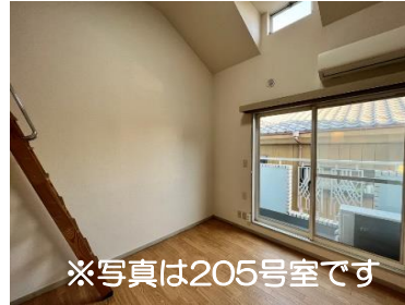
※写真は205号室です バルコニーの日当たりは良好!