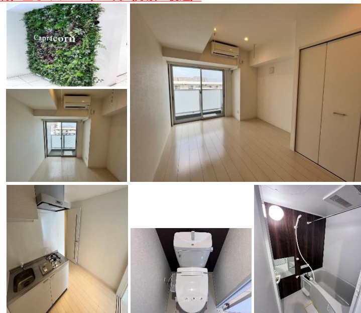
※図面と現況が異なる場合は現況を優先致します