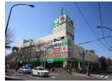
↑スーパーサミット 徒歩10分(約800m)

備考 ■定期借家契約:2年間 ■再契約手数料:新賃料の1ヶ月分 ■解約通知期限:2ヶ月前 ■室内クリーニング費(エアコン内部洗浄含む):88,000円(税込・退去時) ■鍵交換費:22,000円(税込・退去時) ■当社指定火災保険加入必須 ■1年未満解約違約金あり ■保証会社加入必須 ※初回保証料:月額総賃料の1ヶ月分 更新保証委託料:10,000円/年 但し、保証会社によって初回保証料・更新保証委託料の増減があります。