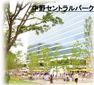
中野セントラルパーク